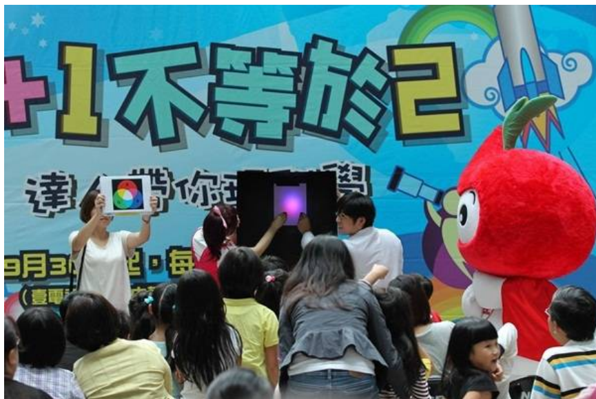
▲壹電視《1+1不等於2》科教館與達人秀科學