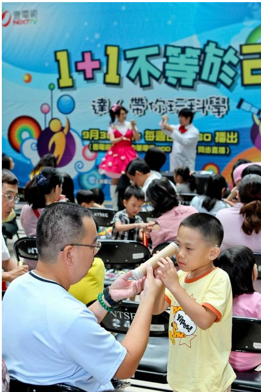
▲壹電視《1+1不等於2》科教館與達人秀科學