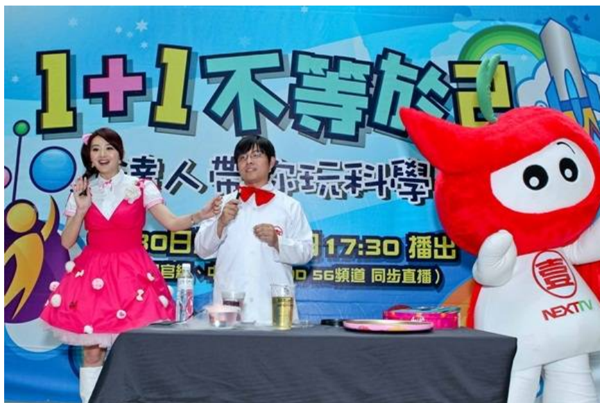
▲壹電視《1+1不等於2》 科教館與達人秀科學

為什麼補牙時牙醫要用藍光照？為什麼鑽石會bling bling閃？為什麼有些鏡子可以把人變胖、有些鏡子卻把人變瘦？生活中有這麼多不可思議的為什麼，到底是為什麼呢？即將於9月30日下午五點半在壹電視新聞台跟大家見面的《1+1不等於2》，為了讓小朋友搶先體驗「輕鬆玩科學」的樂趣，特地與國立台灣科學教育館合作，在9月16日與10月6日各舉辦兩梯次的「達人帶你玩科學」免費活動，讓小朋友們與達人一起動手玩科學。