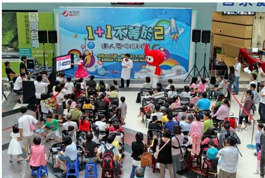
▲壹電視《1+1不等於2》科教館與達人秀科學